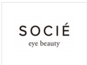
アイビューティサロン ソシエ